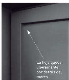
Hoja con revestimiento tradicional