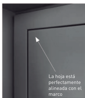
Hoja coplanar de la colección

Nada interrumpe la continuidad de las líneas: superficie plana, formas geométricas integradas perfectamente a lo alto y a lo ancho, integración sutil de los accesorios... La gama SURFACE eleva los límites de la pureza de líneas y de la elegancia.